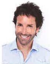
Éric Salvail animateur

C'est un rendez-vous, le 26 avril 2013, à la 2 e édition du TéléDon de la Fondation Hôpital Saint-Eustache. Isabelle Racicot et Éric Salvail seront vos animateurs de la soirée, en plus d'autres invités.