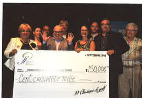
Tournoi de golf 2012 : 150 000 $