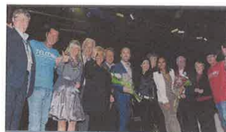
1 er TéléDon 2012 : 93 843 $