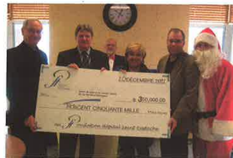
Contribution annuelle 2011 de la Fondation au CSSS : 350 000 $