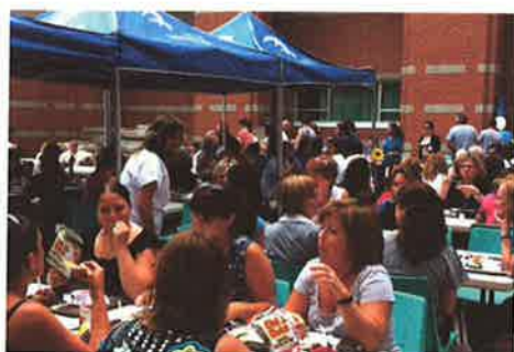
Dîner burgers 2012 : 2 567 $