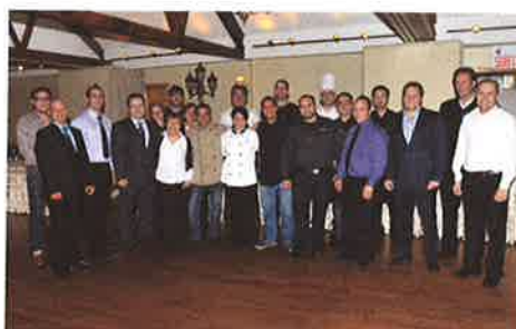
Souper gastronomique des restaurateurs 2012 : 10 170 $