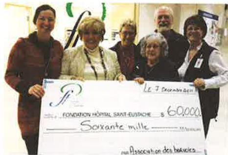
Association des bénévoles du CSSS 2011 : 60 000 $