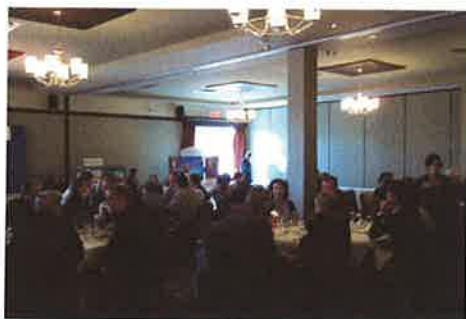
Journée scientifique 2011 : 17 200 $