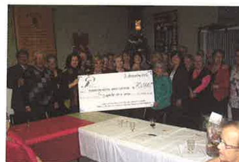
Association des bénévoles du CSSS 2012 : 70 000 $