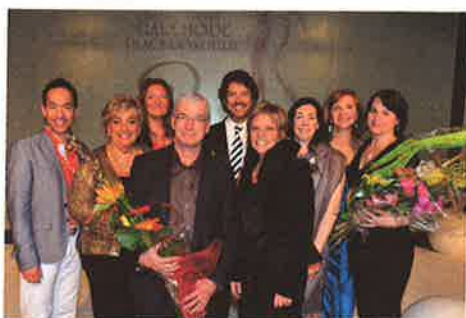
Gala mode 2012 : 22 115 $